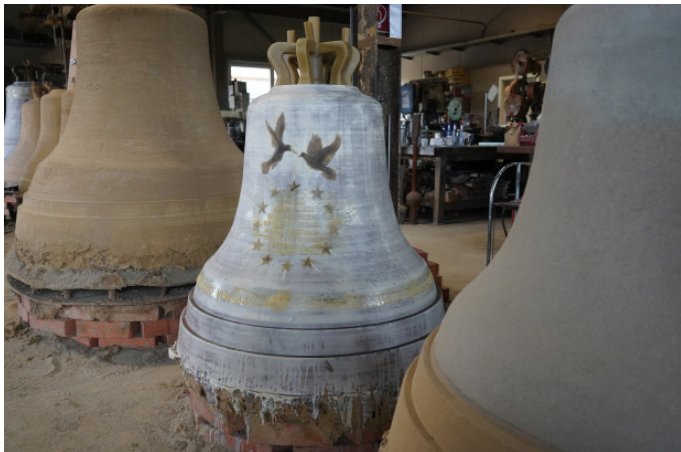
Projekt „Friedensglocken für Europa“