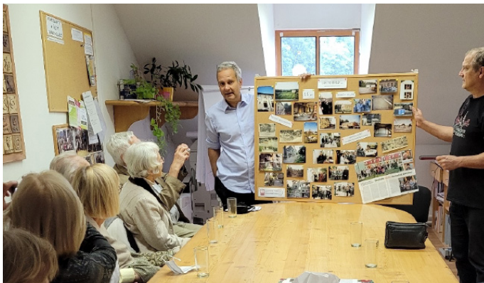
Begegnung in Ostrava