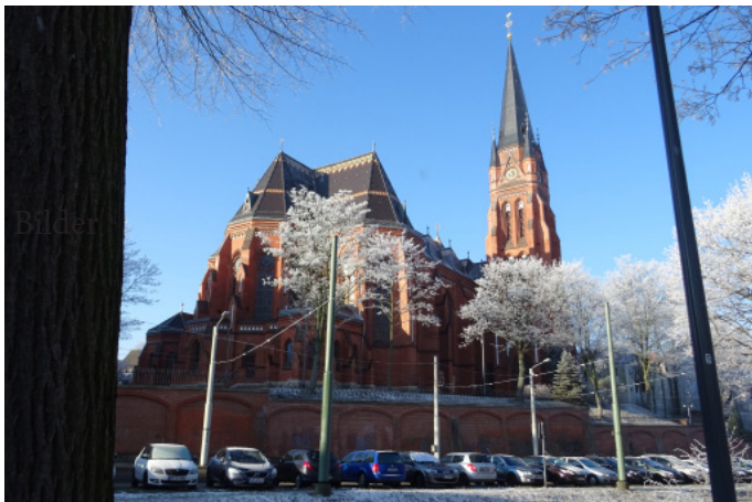
Kathedrale in Görlitz